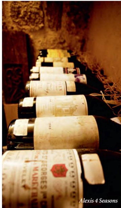
Alexis 4 Seasons