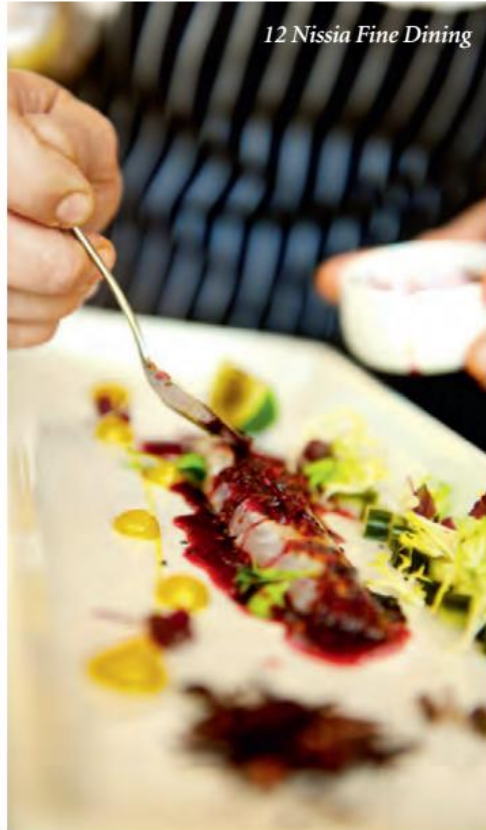
12 Nissia Fine Dining