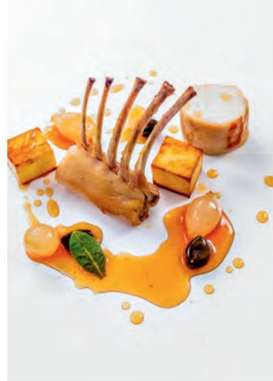
Armonia Bay Hotel

It offers an interesting mixture of Mediterranean, Scandinavian and Asian flavours that will constantly tease your palate. Η κουζίνα του προτείνει ένα ενδιαφέρον μείγμα μεσογειακών, σκανδιναβικών και ασιατικών γεύσεων, που προκαλεί συνεχώς τον ουρανίσκο σας. Rhodes Town, +30 22410 39805, restaurantwonder.gr